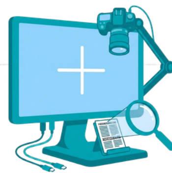
Lettura e dettagli