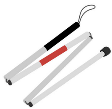
Mobilità e autonomia

Due giornate dedicate alle novità per la disabilità visiva tra autonomia, mobilità, comunicazione, scuola, lavoro e tempo libero.