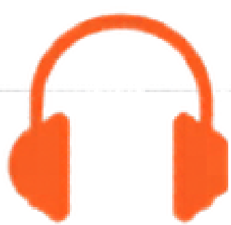
Ascolto e contenuti